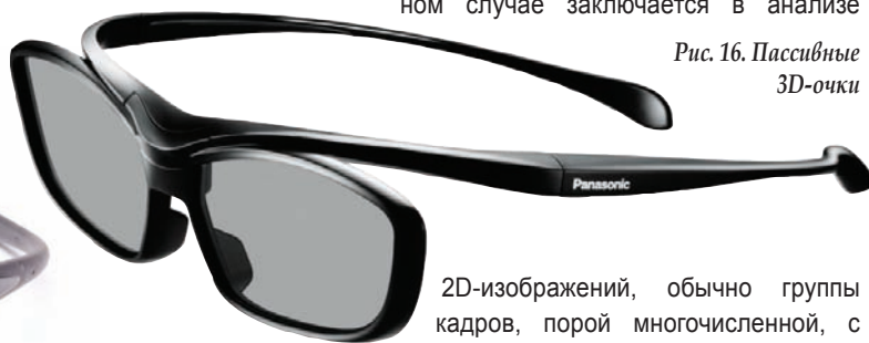
Рис. 16. Пассивные 3D-очки

В случае применения системы с пассивными 3D-очками (рис. 16) дополнительные расходы обусловлены производством ЖК-панели (эта технология применима для плазменных панелей). В ЖК-телевизоре формата 3D экранный поляризатор имеет слой меняющих свое положение полос правого и левого фильтров, которые точно выровнены с элементами изображения панели. При просмотре обычного – плоского – изображения без очков зритель