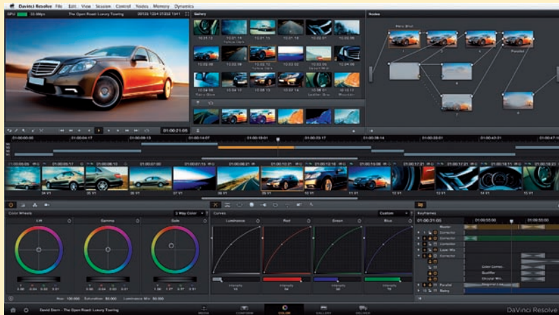
Интерфейс цветокоррекции DaVinci Resolve

Остается повторить, что все, кто уже имеет тестовую DaVinci Resolve, могут бесплатно скачать DaVinci Resolve 9 с сайта Blackmagic Design, а бета-версия DaVinci Resolve Lite public доступна для всех желающих, в том числе и тех, кто только начинает осваивать цветокоррекцию. Предусмотрены варианты для операционных систем Mac OS X и Windows.