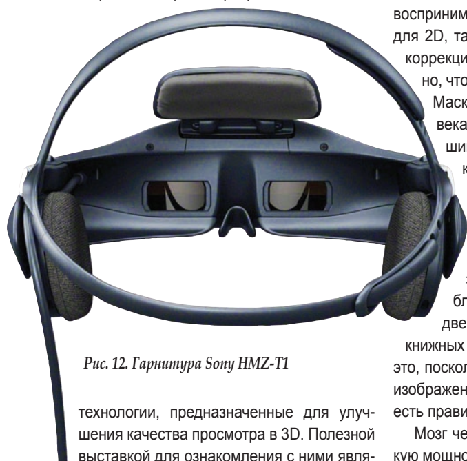
Рис. 12. Гарнитура Sony HMZ-T1

На этом возможности мозга по коррекции 3D-картинки не заканчиваются. Использование одной ручной 2D-камеры для съемки пары объемных 3D-изображений неподвижных объектов приведет к появлению множества дополнительных ошибок, если только вам не будет сопутствовать несказанная удача. В число этих ошибок входят различие в масштабе правого и левого ракурсов из-за того, что они сняты с несколько разного расстояния до объекта. Трапециевидные искажения (вертикальные и поперечные) практически не-