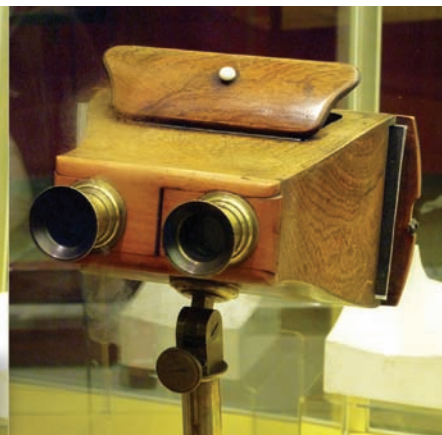
Рис. 14. Стереоскопический визир Maxwell

Важно отметить, что съемочные группы, работающие в 3D, могут выбрать одно из трех: сделать все правильно во время съемки; попытаться исправить небольшие дефекты во время монтажа и обработки; просто закрыть глаза на бракованные планы и положиться на то, что мозг зрителей все сделает сам во время просмотра. В последнем случае велик риск, что зрители уйдут домой с головной болью.