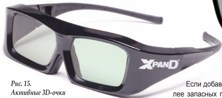
Рис. 15. Активные 3D-очки

Большая проблема состоит в том, что преобразование 2D в 3D никогда не может быть безупречным, вне зависимости от того, какие ресурсы по обработке изображения выделяются на это. И визуально это не пойдет ни в какое сравнение с 3D-материалом, изначально снятым в формате стерео. Суть обработки в данном случае заключается в анализе